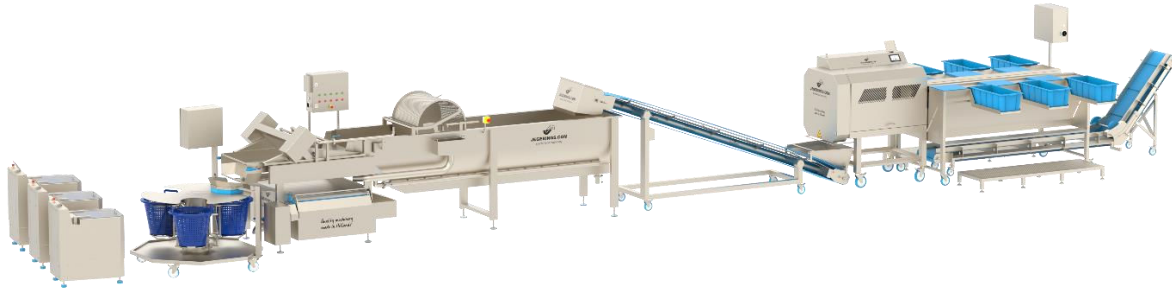
HCB-600-TS dans une ligne de transformation de légumes pour couper, laver et sécher des légumes

Le HCB-600-TS est un convoyeur qui peut être intégré dans une ligne de traitement pour couper, laver et sécher des légumes. Ce convoyeur récupère les légumes coupés de la machine à découper et transporte les légumes vers la cuve de lavage de la laveuse. Avec le HCB-400-TS, il n'est plus nécessaire de transporter manuellement les légumes coupés de la machine de découpe à la machine à laver.