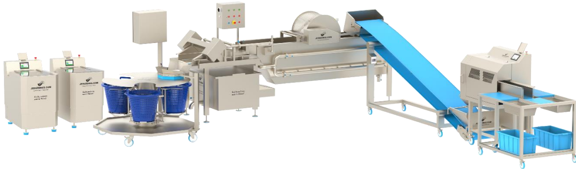
HCB-400-TS in een groenteverwerkingslijn voor het snijden, wassen en drogen van groente

De HCB-400-TS is een transportband die naadloos kan worden geïntegreerd in een verwerkingslijn voor het snijden, wassen en drogen van groenten. Deze transportband verzamelt de gesneden groenten van de BCM bandsnijmachine en transporteert de groenten naar de wasbak van de wasmachine. Hierdoor vervalt de noodzaak om de gesneden groenten handmatig van de snijmachine naar de wasmachine te transporteren.