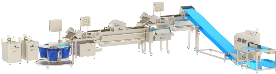
HCB-400-TS verlengd voor een 2-fase wassysteem

De HCB-400-TS kan ook worden verlengd zodat deze transport geschikt is voor een meerfase groentewassysteem. De normale uitvoering van de HCB-400-TS is geschikt voor een groentewerwerkingslijn met een groentewasser, maar deze transportband kan ook verlengd worden zodat deze geschikt is voor een 2-fase of 3-fase wassysteem.